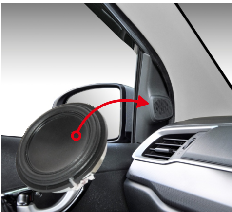
No Mounting (OEM Tweeter Replacement)

Small is the New Quality Direct Sound 1khz - 20khz Sensitivity 83db, 4 Ohm