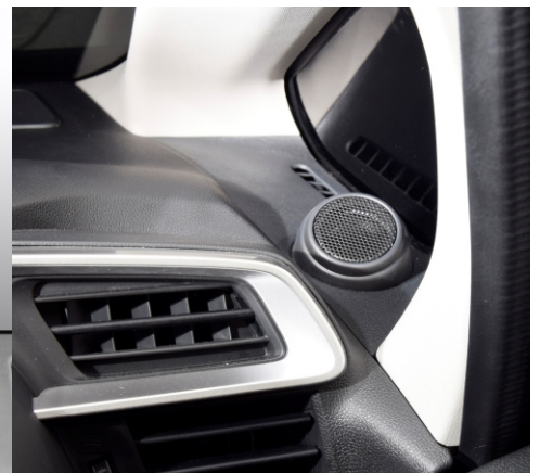
OEM Mounting (Panel 1F)

Solution FIT dipasang di tempat original menggantikan tweeter original dan sudah pasti dapat menjadi solusi praktis meningkatkan speaker original mobil Anda. Ditunjang dengan desain mounting Micro Fullrange yang compact, meminimalkan risiko blind spot .